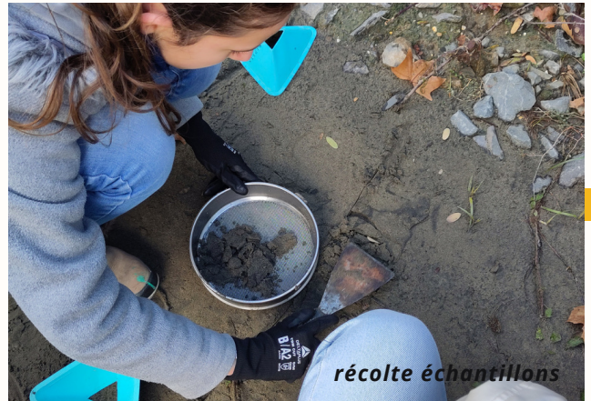
Les déchets plastiques seront ensuite triés puis étiquetés avant d'être envoyés à Tara.

Les données collectées alimenteront la recherche scientifique.