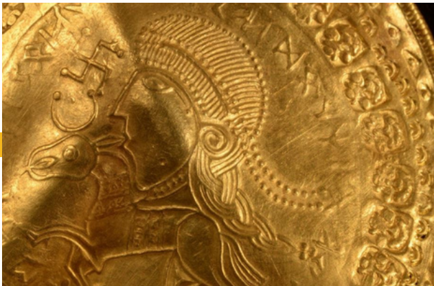
Les bractéates faisaient office de médaille ou de monnaie.

Ce sont en effet pas moins de 22 objets en or qui ont été trouvés: des pièces de monnaie, un médaillon, un bracelet,... le tout richement orné; ils dateraient de la période pré-viking!