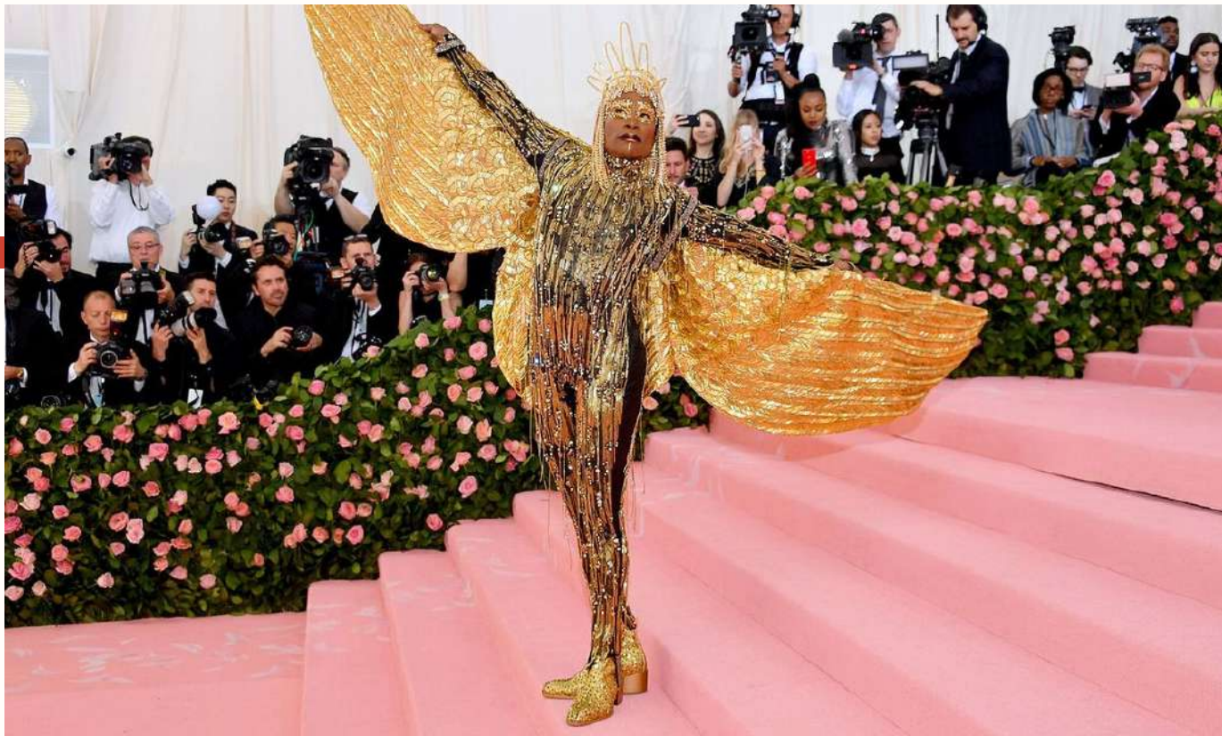
Met Gala 2023

Retour sur l'événement mode Par Ginevra Torre