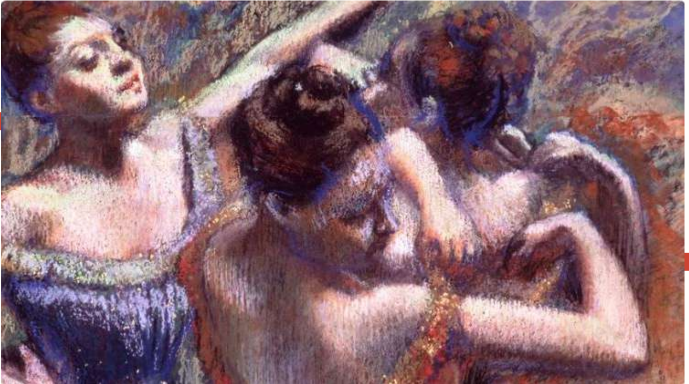
"Les danseuses", Edgar Degas, 1899