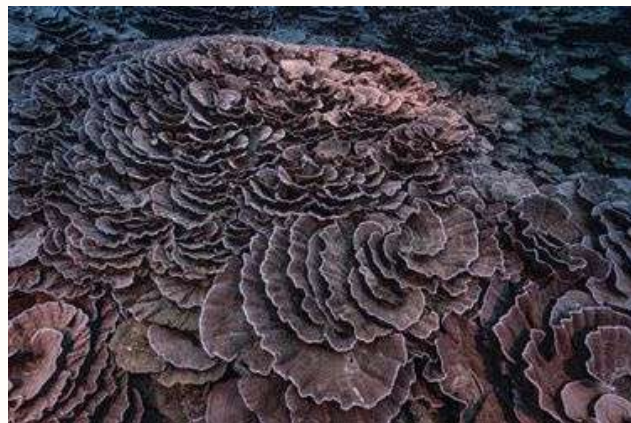
Des formes qui font penser à des roses géantes, photo: © Alexis Rosenfeld

Le récif qui s'étend sur 3 km de long et situé entre 35 à 70 mètres de profondeur , a été observé pour la première fois lors de plongées sous-marines organisées dans le but de cartographier les fonds marins de Polynésie et a subjugué les plongeurs par ses coraux en forme de roses géantes .