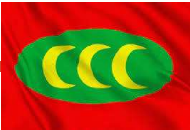
Drapeau Empire Ottoman

C'est pour immortaliser cette victoire que les boulangers de la ville confectionnèrent le Hörnchen ("petite" corne en allemand), dont la forme rappelle le symbole du drapeau ottoman.