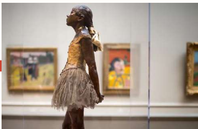
"La Petite Danseuse de 14 ans", statue exposée ici en 2014 à la National Gallery de Washington (Etats-Unis).

Parmi les scandales provoqués par les œuvres de Degas : La Petite Danseuse de 14 ans , une statue qui, lorsqu'elle est pour la première fois exposée, en 1881, suscite les plus vives critiques. En effet, l'exposition du corps de la jeune danseuse va être jugée indécente et reprochée à Degas.