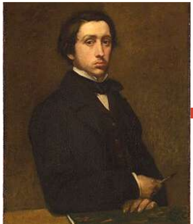
Autoprotait de l'artiste, heuile sur toile, 1855

Degas s'est opposé aux changements sociaux et aux innovations de son époque. Il arrête finalement de peindre en 1912, alors qu'il est presque aveugle.