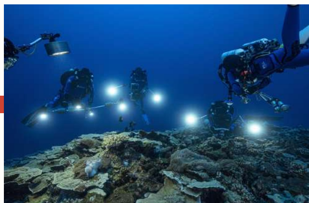
Au large de Tahiti, des scientifiques explorent une rare étendue de coraux vierges en forme de rose.

Découverte d'un gigantesque récif corallien encore intact!