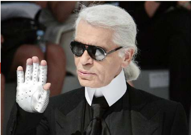
Karl Lagerfeld, lors du défile Chanel automne-hiver 2009