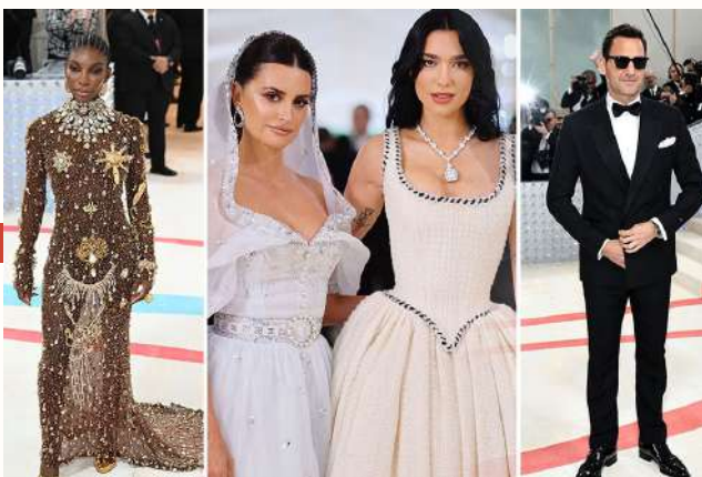
Michaela Cole Penélope Cruz et Dua Lipa et Roger Federer

Cette année les présentateurs étaient Penélope Cruz fameuse actrice espagnole, Dua Lipa chanteuse anglaise, Michaela Cole actrice britannique, Roger Federer célèbre tennisman suisse (jeune retraité) et Anna Wintour journaliste de la revue Vogue.