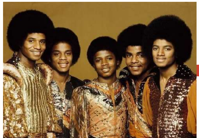
Jackson Five

The parents decided the name " The Jackson Brothers 5 " but it was changed to "The Jackson 5" because it was too long.