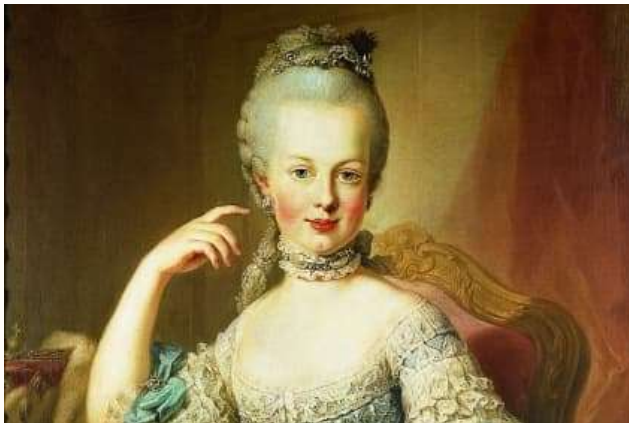
Marie Antoinette d'Autriche