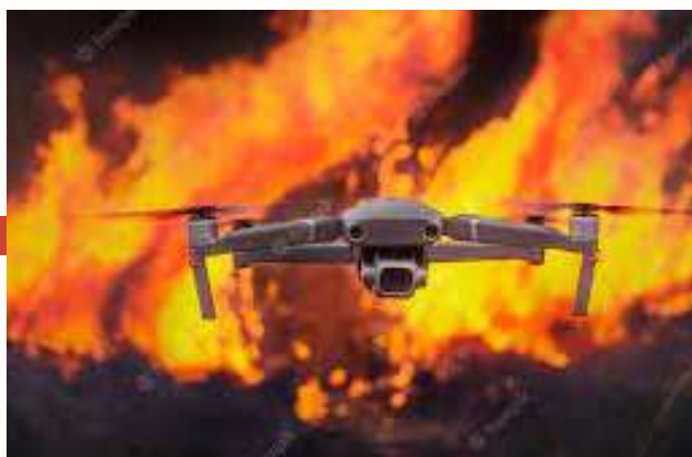
Incendies et drones

Impossible d'ignorer les feux qui ravagent les forêts durant l'été. En Suisse , des chercheurs ont réussi à fabriquer un drone qui pourrait être déployé dans les bâtiments et les forêts en feu. Il est résistant à la chaleur grâce à une couche protectrice en aérogel , peut voler directement dans un incendie pour trouver les personnes prises au piège.