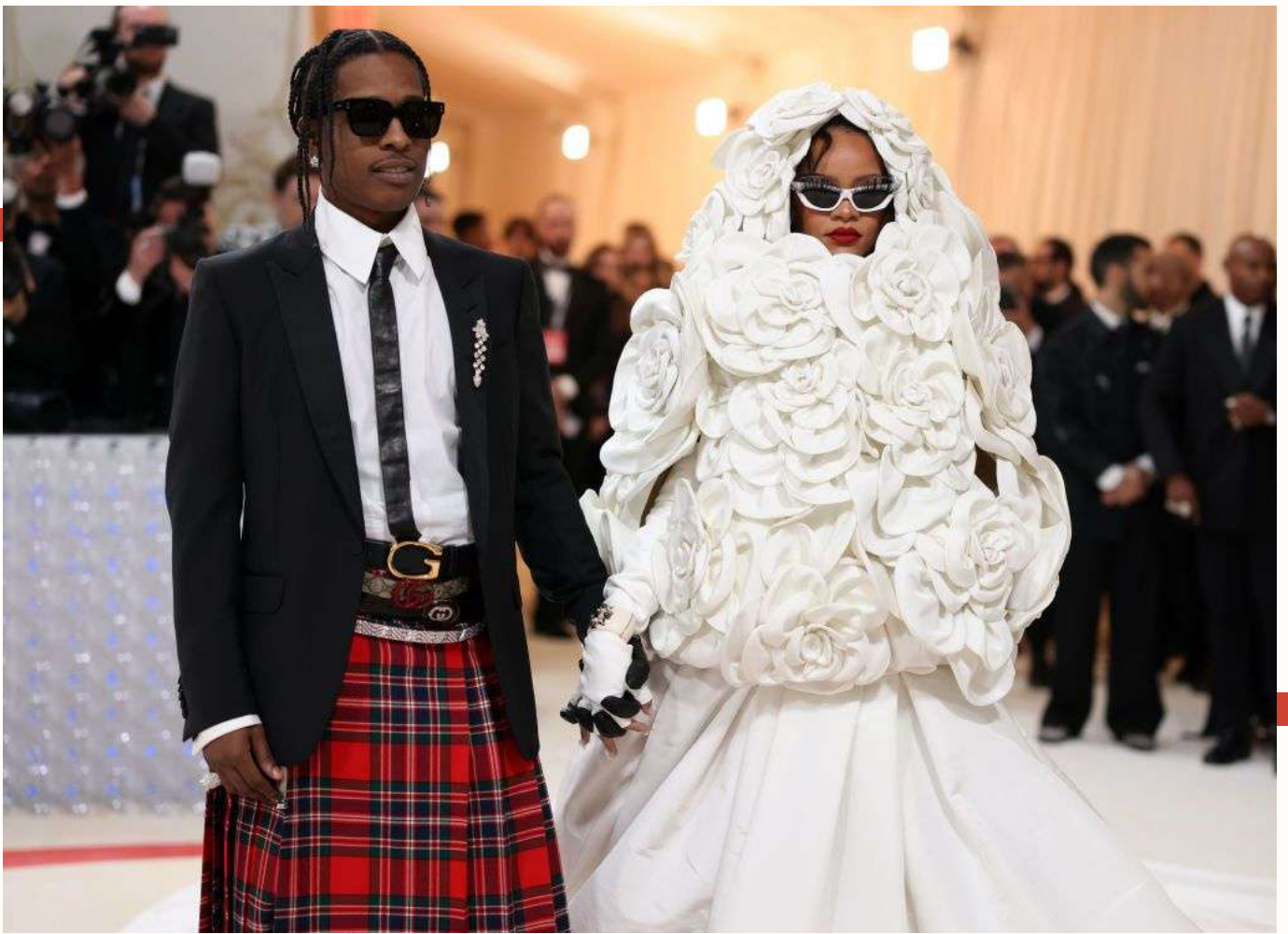
A$AP Rocky and Rihanna attend the 2023 Met Gala.

Rihanna , la chanteuse à succès, actrice, styliste et femme d'affaires, enceinte de son deuxième enfant ne laissa pas présager son look: une impressionnante robe blanche Valentino avec d'imposantes fleurs sur le haut et la capuche.